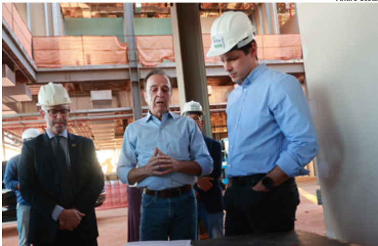
Daniel Vilela vistoria obras do Complexo Oncológico de Referência do Estado de Goiás (Cora)