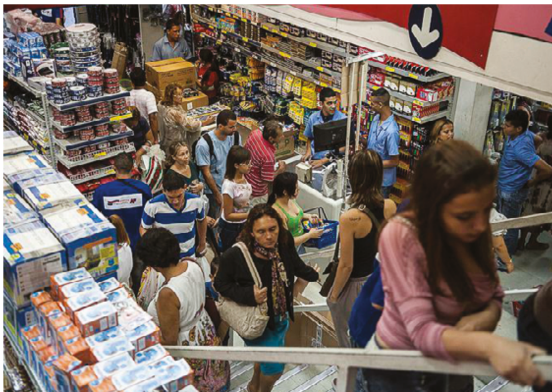
Índices são do Cempre, que reúne dados cadastrais e econômicas das empresas e organizações no país