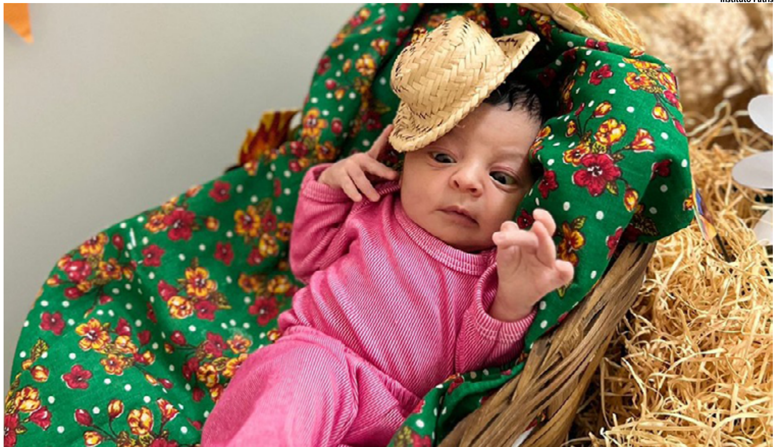
Um dos recém-nascidos que ‘posaram’ para o ensaio fotográfico junino da maternidade do HEL