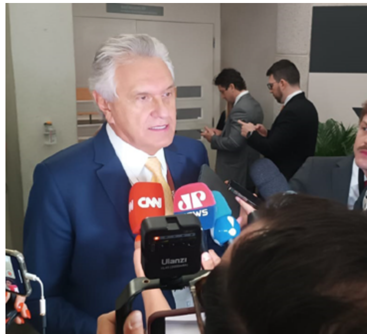
Ronaldo Caiado em Lisboa: defesa dos produtores goianos