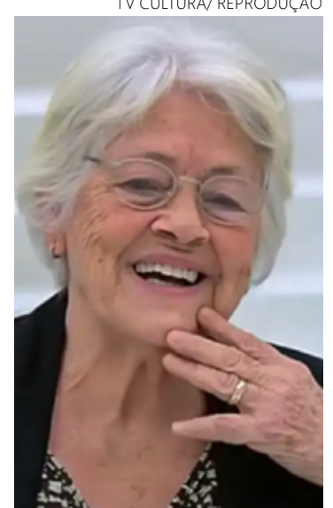
Adélia Prado recebeu láurea ontem

O prêmio concede à autora um valor de 100 mil euros, ou cerca de R$ 590 mil reais divididos entre o governo de Portugal e a Biblioteca Nacional brasileira.