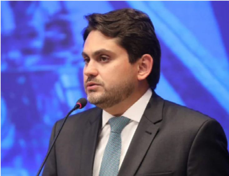
Juscelino Filho não pretende entrar cargo ao presidente

Nesta quarta, o ministro disse ao jornal O Globo que seguirá no cargo enquanto Lula quiser. “Cargo de ministro é de presidente. Até o dia que ele quiser eu vou cumprir a missão que ele me deu com muita honra, trabalhando pelo Brasil, fazendo o que eu estou fazendo com muita tranquilidade”, afirmou.