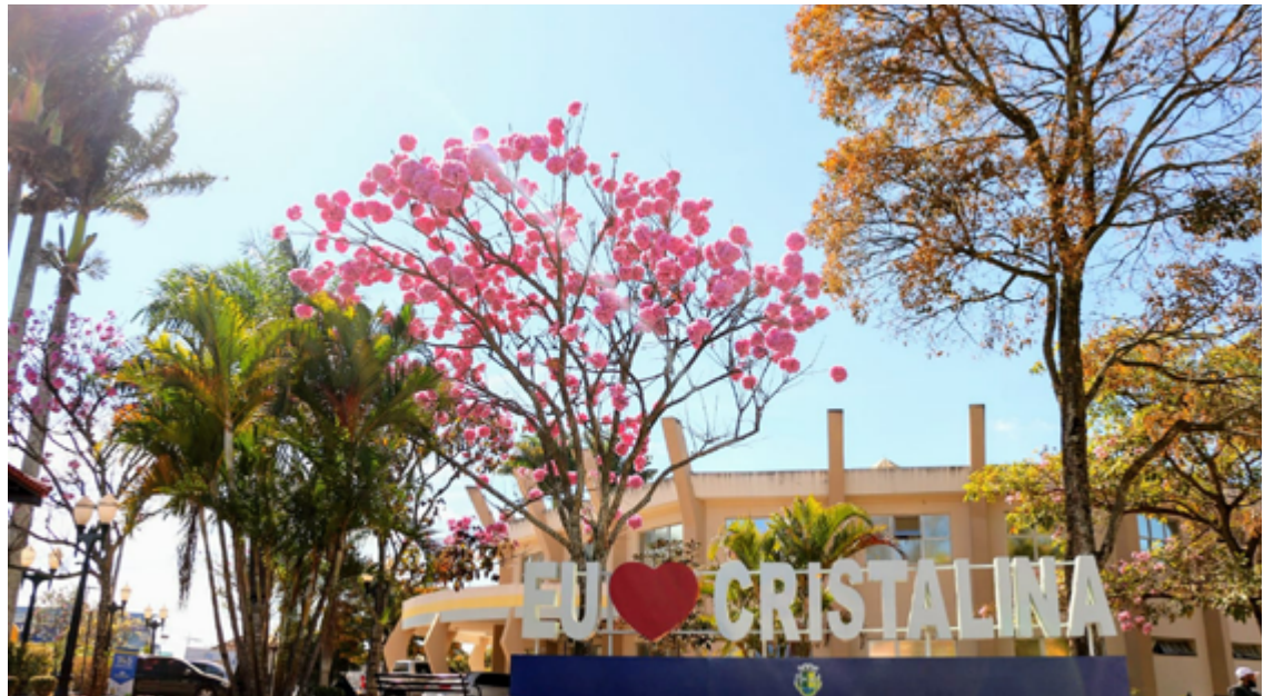
Além do impacto econômico, Cristalina se destaca como um destino turístico de grande relevância

Cristalina, com sua abundância de cristais e a tradição de mineração, tem desempenhado um papel crucial na história econômica de Goiás. A cidade é um exemplo de como a exploração sustentável de recursos naturais pode beneficiar a comunidade local, ao mesmo tempo, em