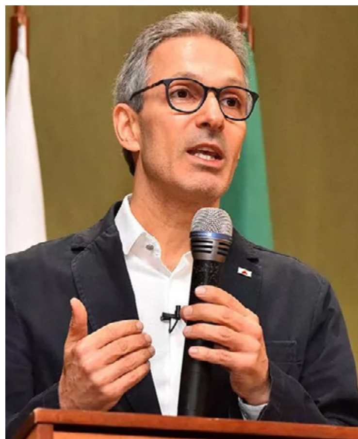
Romeu Zema: alternativa a direita para a disputa a presidente ou a vice-presidente

A confirmação ou não da candidatura de Zema como vice-presidente deve ser acompanhada de perto nos próximos meses, com grande interesse tanto por seus apoiadores quanto por seus adversários.