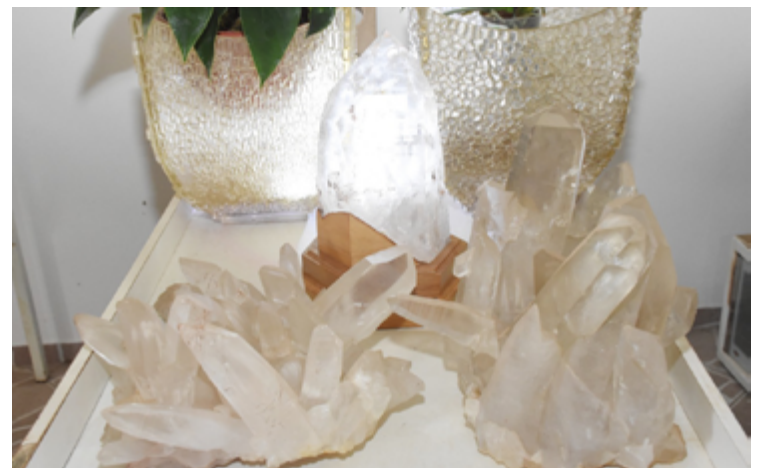
Cristalina, com sua abundância de cristais e a tradição de mineração, tem desempenhado um papel crucial na história econômica de Goiás

O título de Capital Goiana dos Cristais representa um marco significativo, é um reconhecimento da importância histórica e econômica da cidade. A lei sancionada pelo governador Ronaldo Caiado simboliza um compromisso com o desenvolvimento e a valorização das riquezas naturais e culturais de Cristalina, promovendo seu potencial e assegurando seu lugar de destaque no cenário turístico e econômico de Goiás.