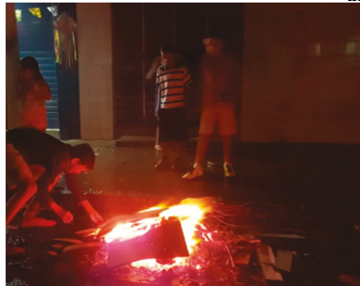
Fogueiras e os fogos de artifício geram problemas leves e graves