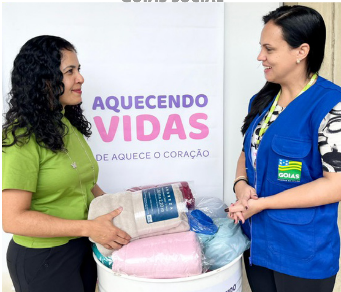
Peças arrecadadas serão doadas a famílias em situação de vulnerabilidade social de todo o estado