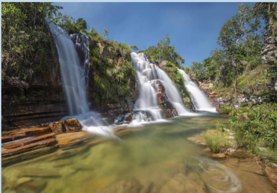
A conexão atende à demanda crescente por melhor infraestrutura de transporte entre Goiânia e Cavalcante, facilitando o acesso a várias cidades turísticas importantes.

A rota, com 528 quilômetros, conecta a capital de Goiás diretamente a cidades-chave como Anápolis, Abadiânia, Alexânia, Planal-