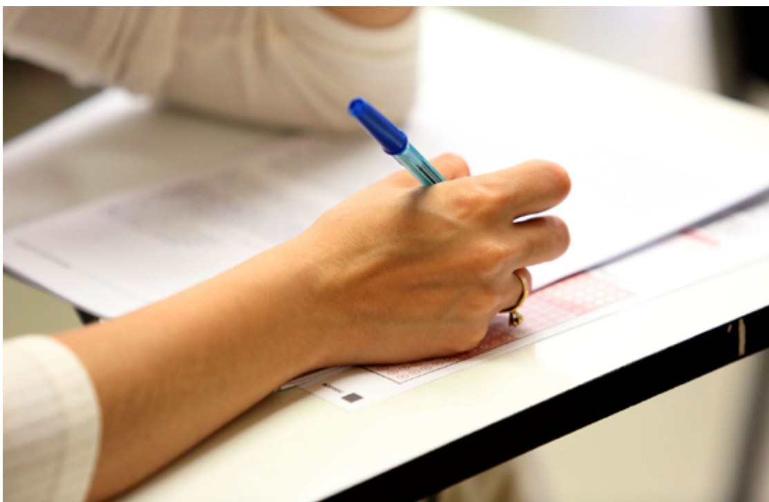
Homologação do concurso aconteceu no dia 20/6/24