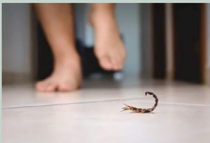
A picada de escorpião representa um sério risco à saúde, especialmente para crianças, idosos e pessoas com comorbidades

A picada de escorpião representa um sério risco à saúde, especialmente para crianças, idosos e pessoas com comorbidades. Os sintomas variam de acordo com a gravidade do envenenamento. Em casos leves, podem incluir dor, vermelhidão da pele e formigamento local. Em casos moderados, os sintomas podem ser sudorese,